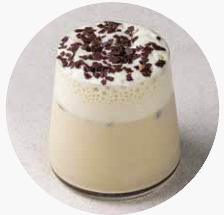
ICE КОФЕ ТИРАМИСУ