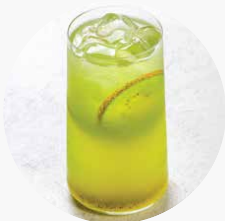
КИВИ-ОГУРЕЦ 390/670 ₺ 400/1000 мл