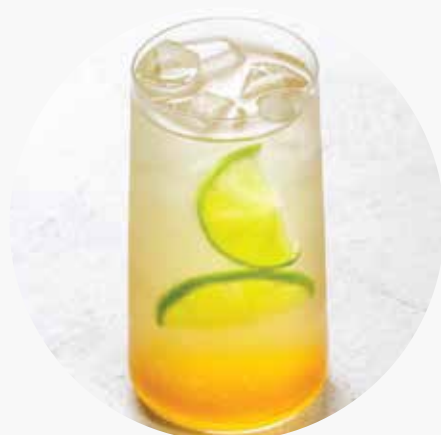
ГРУША-КОКОС 390/670 ₺ 400/1000 мл