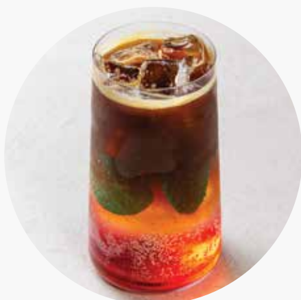
ЭСПРЕССО ТОНИК МАЛИНА-МЯТА 350 ₺ 300 мл