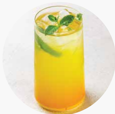
ПЕРСИК-МАРАКУЙЯ 390/670 ₺ 400/1000 мл