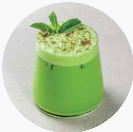
ICE КОФЕ ФИСТАШКА-МЯТА