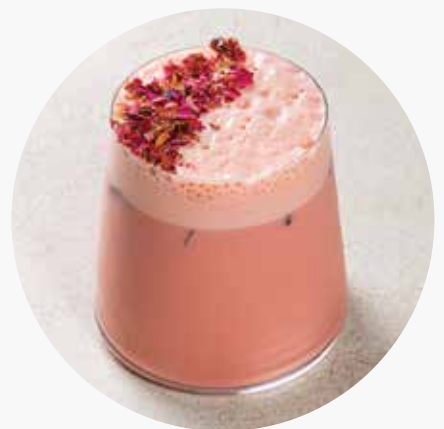
ICE КОФЕ РОЗА-КЛУБНИКА