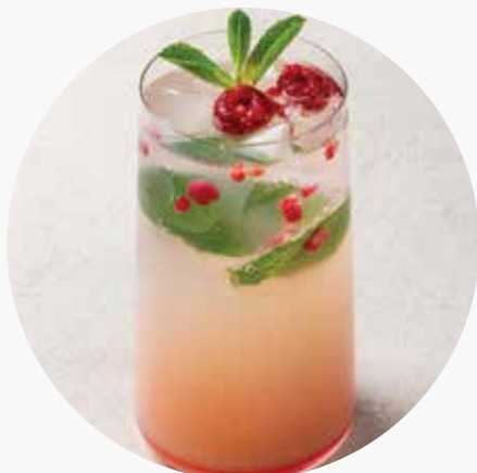
ЛИЧИ-АРБУЗ 390/670 ₺ 400/1000 мл