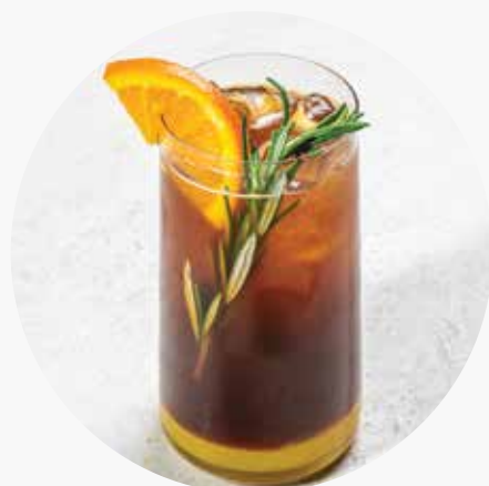
ИСЕ КОФЕ АПЕЛЬСИН РОЗМАРИН 320 ₺ 300 мл