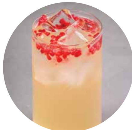
АНАНАС-КОКОС 420/740 ₺ 400/1000 мл