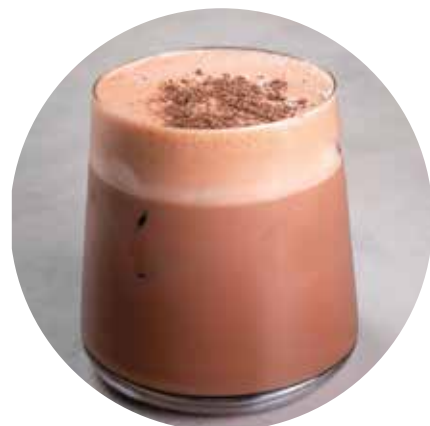
ICE КОФЕ ТИРАМИСУ