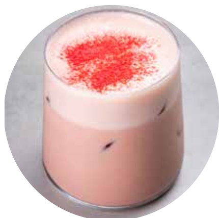
ICE КОФЕ БАБЛ-ГАМ