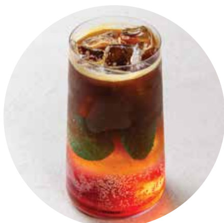
ЭСПРЕССО-ТОНИК МАЛИНА-МЯТА 370 ₺ 300 мл