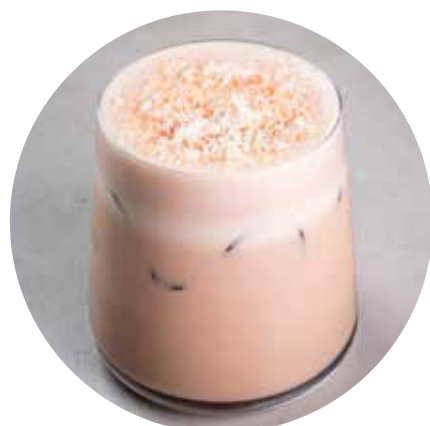
ICE КОФЕ ВЗРЫВНАЯ КАРАМЕЛЬ