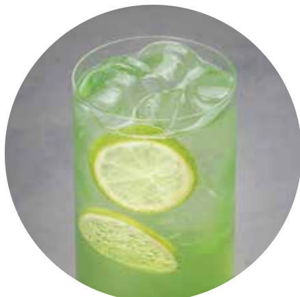
АЛОЭ-ЯБЛОКО 420/740 ₺ 400/1000 мл