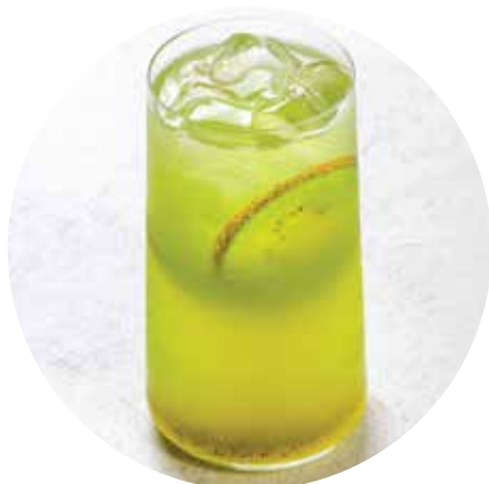
КИВИ-ОГУРЕЦ 420/740 ₺ 400/1000 мл