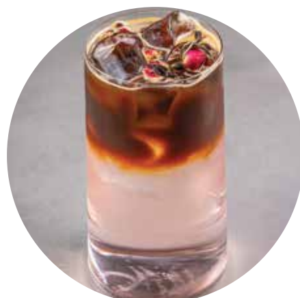
ЭСПРЕССО-ТОНИК РОЗА 370 ₺ 300 мл